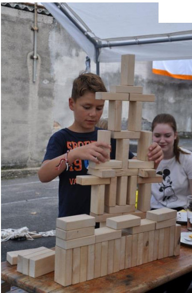
2 Sets Baukid Holzbauklötze, 200 Klötze