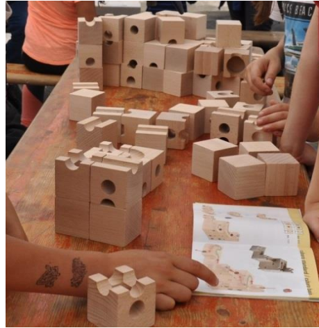
4 Standard-Sets Kugelbahn Cuboro, 216 Teile, 20 Kugeln