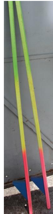
1 Paar Stelzen