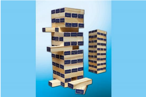
Europa-Spiel EUtinity (2 Sets)